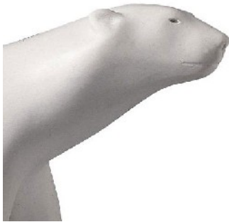
François Pompon, L'Ours blanc (détail).

L' art : se familiariser avec les genres et les techniques artistiques, comprendre ce qu'est une collection.