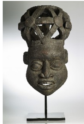
Anonyme camerounais, Masque humain.

La belle et le monstre. Accepter l'autre, apprendre à l'aimer malgré les différences.